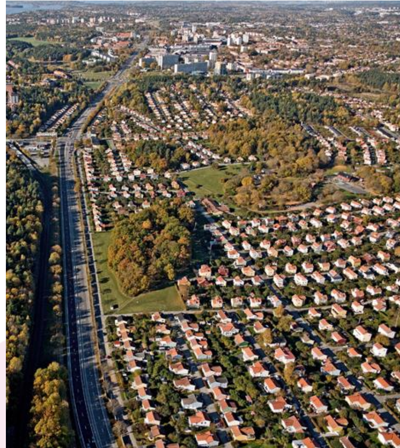
Bild: Flygbild över Norra Ängby