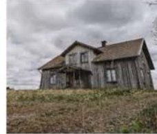
Vill du köpa ett ödehus? | Landsby... landsbygdsdrom.se