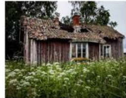
Ödehus i Sverige