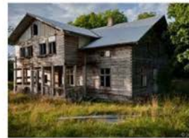
jasifil.se - ödehus i Västra Götaland jasifil.se