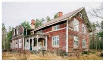
Leva & bo expressen.se