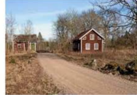
Kommunerna som inventerar ödehus | Land land.se