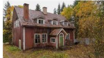
rukkel till salu på Hemnet ... expressen.se