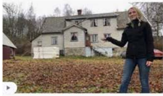
SVT Nyheter svt.se