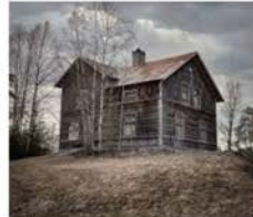
X-files: Ödehus (1 av 4) cyberphoto.se