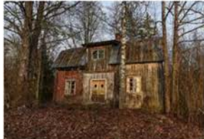
My heaven is all around me.blog.se ... myheavenisallaroundme.se