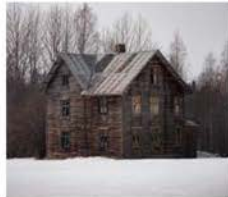
X-files: Ödehus cyberphoto.se