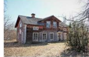
Vore bra för bygden om det kommer folk ... nwt.se