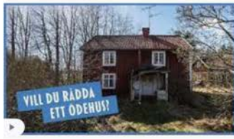
Vill du rädda ett ödehus? - YouTube youtube.com