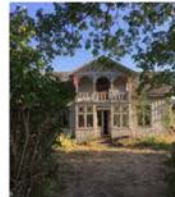
Ödehus och andra hus - ... glavabygden.se