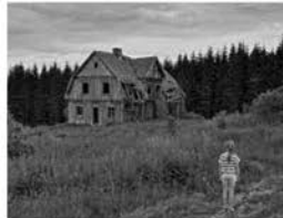
Ödehus | Jag var här för några år seda...