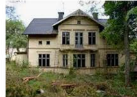
Ödehusets fantastiska öde | Byggahus.se byggahus.se